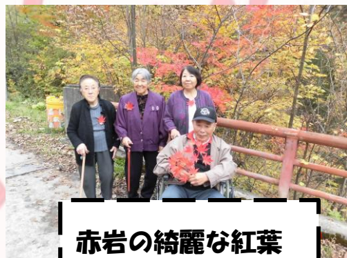
赤岩の綺麗な紅葉