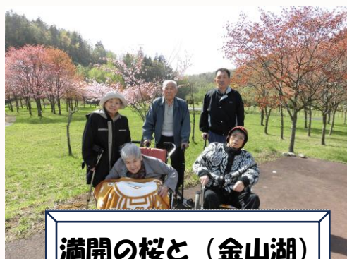
満開の桜と（金山湖）

とま～るは開設10年目を迎えます。地域の皆様に支えられ節目の年を迎えることができました。これまでのご支援に感謝申し上げます。今後も占冠村に住む人たちが、自分らしく住み慣れた地域で暮らしていけるお手伝いができるよう、職員一同努めていきます。