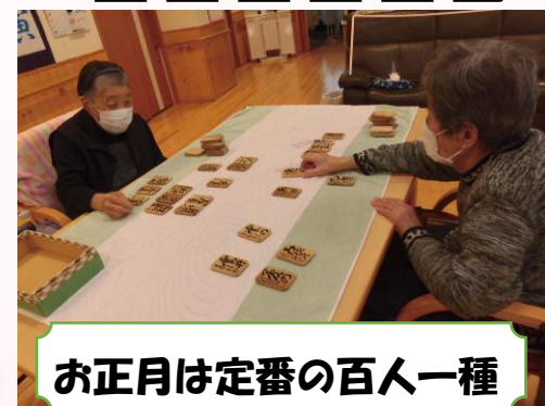
お正月は定番の百人一種

10年の間にたくさんの素敵な思い出ができました。これからも皆さんと楽しい時間を過ごしていきたいです。