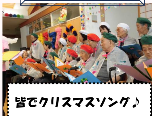
皆でクリスマスソング♪