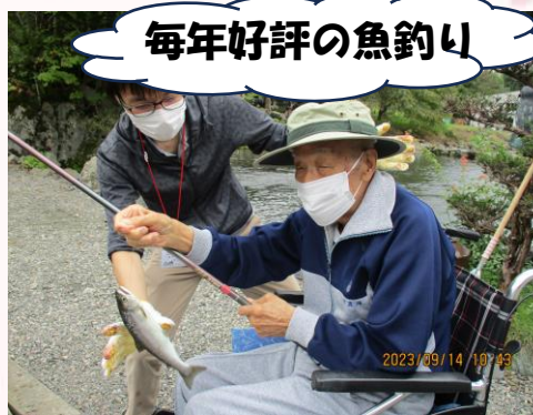
毎年好評の魚釣り