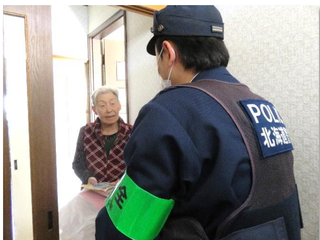
特殊詐欺にご注意ください！

10月14日は、ゆうあいサークルの皆さんと警察署の協力により、今年度第2回目の代替事業として、高齢者宅を訪問し、ゆうあいサークルの皆さんが手作りした絵手紙や防犯チラシなどを持って訪問。皆さんお元気で、色々なお話を聞かせていただきました。