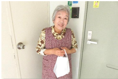
「メッセージカードの配布事業」より