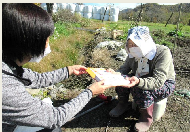
昼食会代替事業（自宅訪問）