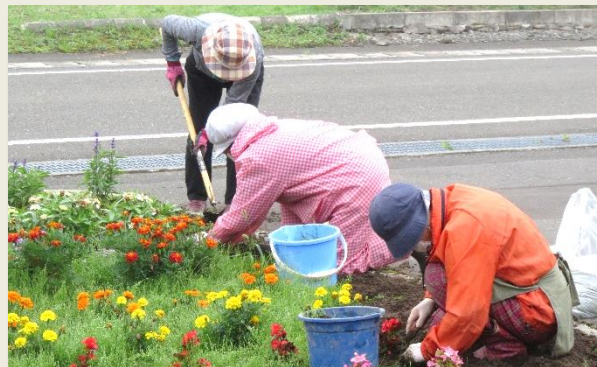
早朝の草取り（保健福祉センター）