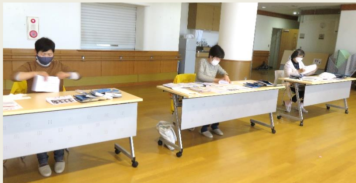
高齢者への配布物準備

一昨年から続く新型コロナウイルスの影響で、交流事業の一部を代替事業に切り替えるなど、変則的な状況にあっても、ゆうあいサークルの皆様には、今年も様々なボランティア活動をお願いし、快くご協力いただきました。一部ではありますが、今年度の活動の様子を写真でご紹介します。