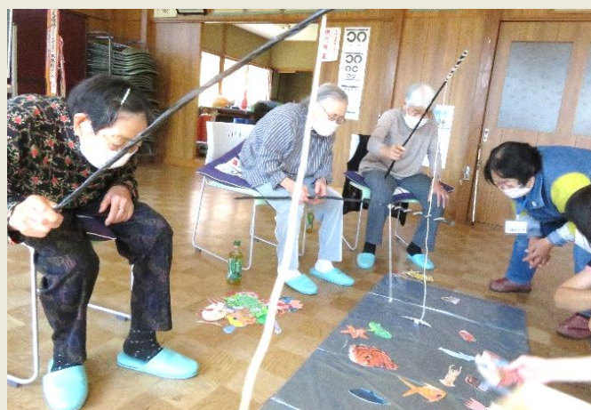
お茶会レクリエーション（双珠別地区）